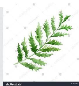
Референсы к папараць-кветке и листьям папоротника