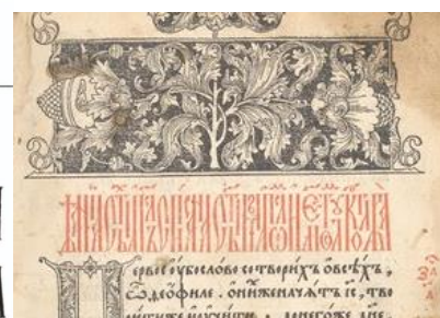
Референсы к шрифту «Беларусь»